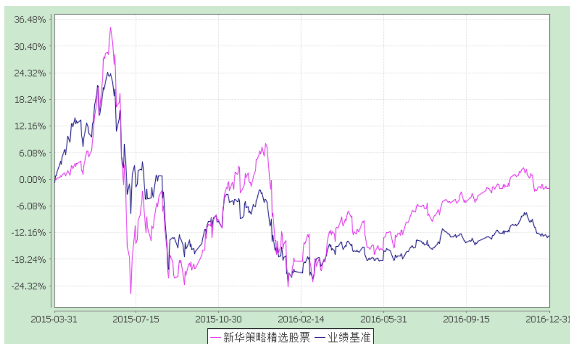
份额累计净值增长率与业绩比较基准收益率的历史走势对比图 (2015 年 3 月 31 日至 2016 年 12 月 31 日)