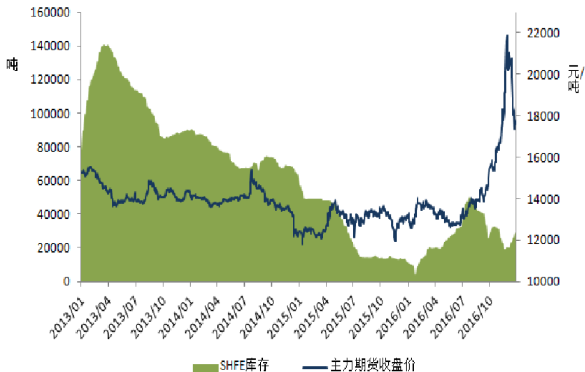
SHFE 铅库存和主力合约价格

2016 年沪铅主力合约均价为 14,664 元/吨，同比上涨 13.6%。2016 年国内现货市场铅价均价为 14,530 元/吨，同比上涨 11.0%。