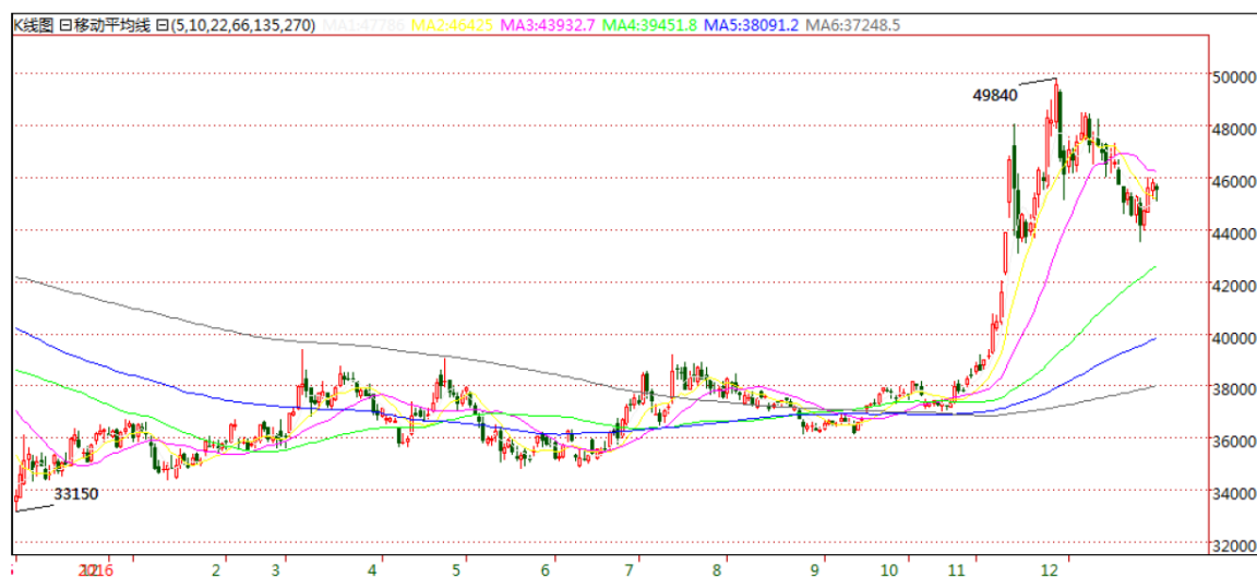
SHFE 三个月期铜日 K 线图

2016 年 SHEF 三个月期铜 2016 年最后一个交易日收盘价格较 2015 年最后一个交易日上涨 24.5%，2016 年 SHEF 当月期铜和三个月期铜均价分别为 38,152 元/吨和 38,203 元/吨，同比下跌 6.11%和 5.87%。