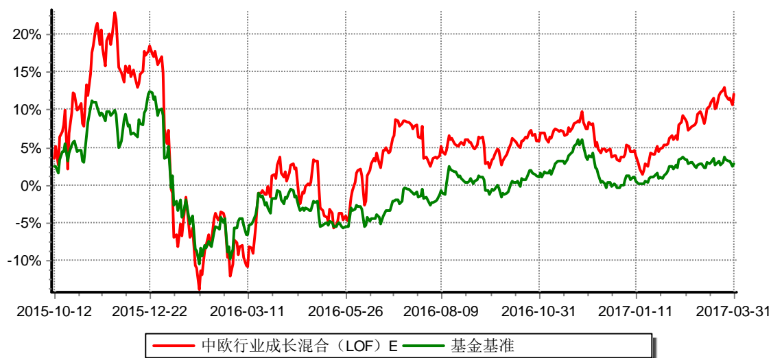
累计净值增长率与业绩比较基准收益率历史走势对比图 (2015年10月12日-2017年03月31日)

注：本基金于2015年10月8日新增E份额，图示日期为2015年10月12日至2017年03月31日。