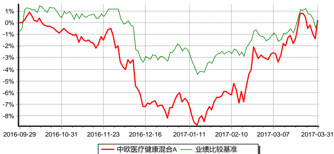
中欧医疗健康混合A 基金累计净值增长率与业绩比较基准收益率历史走势对比图 (2016年09月29日-2017年03月31日)

注：本基金基金合同生效日期为2016年9月29日，自基金合同生效日起到本报告期末不满一年，按基金合同的规定，本基金自基金合同生效起六个月为建仓期，建仓期结束时各项资产配置比例已符合基金合同约定。