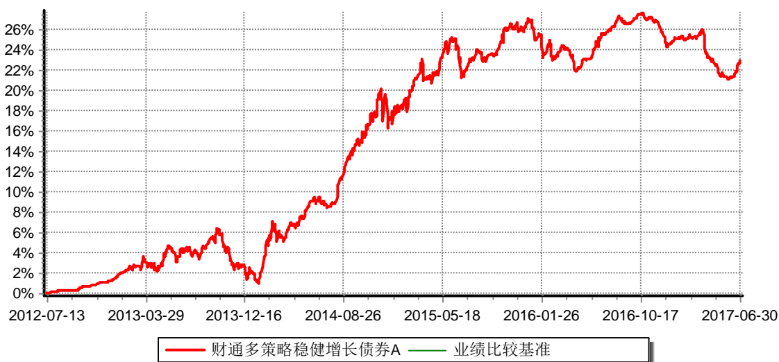
财通多策略稳健增长债券型证券投资基金A 累计净值增长率与业绩比较基准收益率历史走势对比图 (2012年7月13日-2017年6月30日)