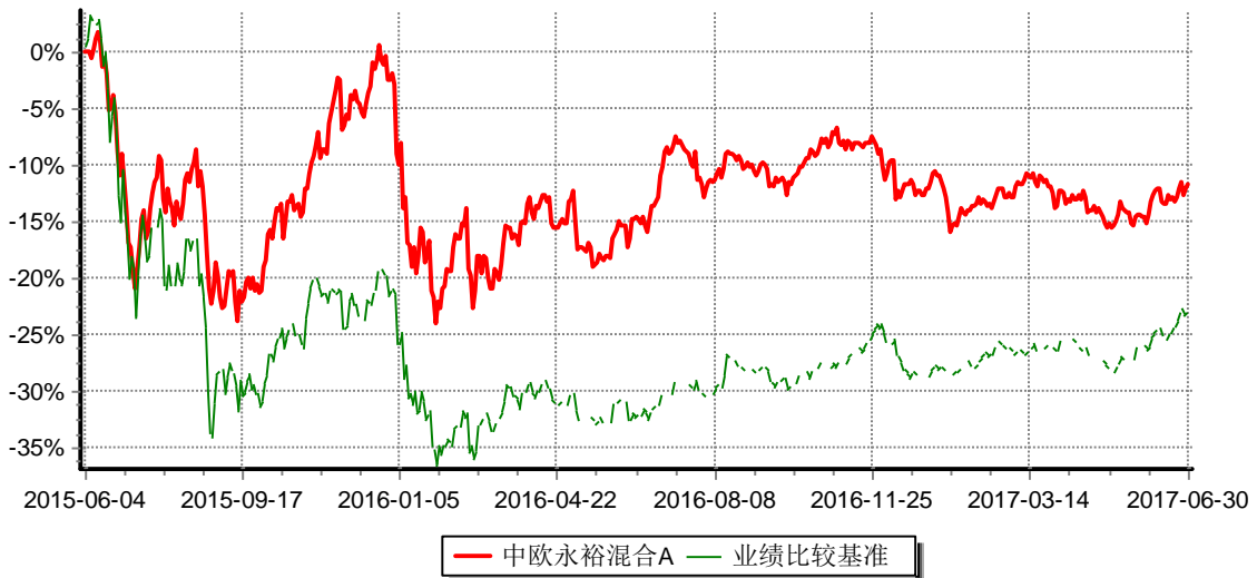
累计净值增长率与业绩比较基准收益率历史走势对比图 (2015年06月04日-2017年6月30日)