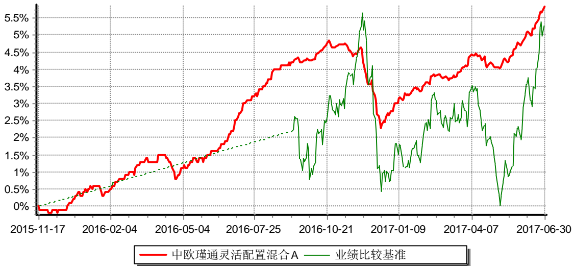
中欧瑾通灵活配置混合A 累计净值增长率与业绩比较基准收益率历史走势对比图 (2015年11月17日-2017年6月30日)

注：自2016年9月5日起，变更业绩比较基准至沪深300指数收益率*50%+中债综合指数收益率*50%。