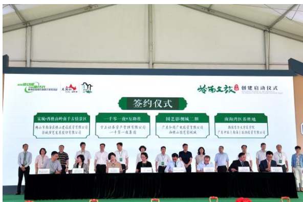
宋城·西樵山岭南千古情景区项目签约仪式

展得到充分印证，进一步巩固了公司的行业地位。未来公司将优选项目地促进轻资产输出模式的发展，为公司创造新的利润点，巩固公司的行业地位。