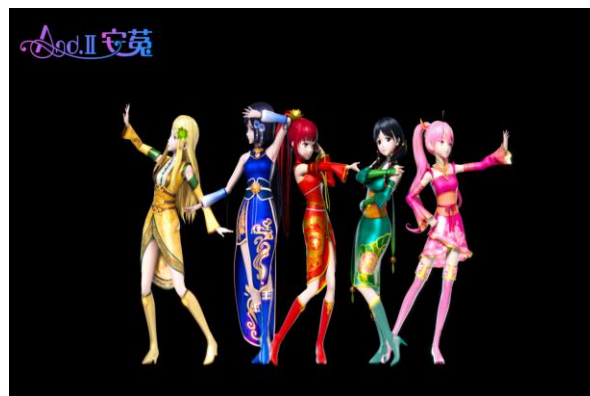
全球首个AR女子演艺团体“ And.II ”发布

报告期内，六间房拥有 27 万名签约主播；月均页面浏览量达 7.02 亿；注册用户数超 5,300 万；总体月度活跃用户 5,481 万，其中网页端月度活跃用户 4,427 万，移动端月度活跃用户 1,054 万；日演艺总时长 60,900 小时；月人均 ARPU 值 682 元。