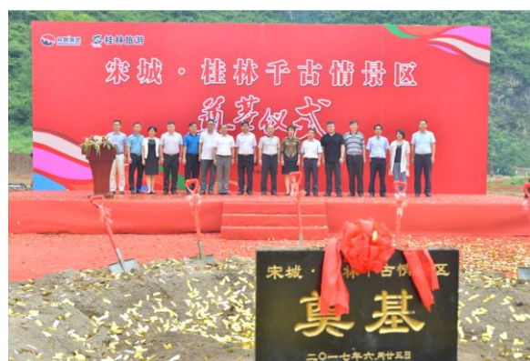
宋城·桂林千古情景区正式开工奠基

同时，在艺术研发、规划设计方面公司将在自主创意结合外部合作的基础之上，加大研发经费和人员投入，集思广益、提高效率和加速成果创新，提升文化科技和规划布局的创新能力，着力打造国际一流的演艺研发团队和品牌。