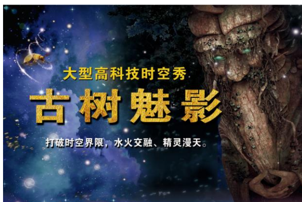
杭州宋城大型高科技时空秀《古树魅影》惊艳杭城

报告期内，公司旗下宋城科技与加拿大时光工厂合作打造的大型高科技时空秀《古树魅影》震撼推出，丰富了宋城景区的游客体验。报告期内，公司探索机器人在娱乐场景的运用落地，将 NAO、Pepper 机器人成功引进烂苹果乐园，使机器人与表演互动相结合，并推出了新的互动节目《卡通机器人见面会》，深受小朋友们的喜爱。公司与美国 Spaces 公司合作研发的全走动式 VR 体验项目也在有序推进中。另外，更多科技手段在舞台表演中的运用正在逐一实施，等待精彩亮相。