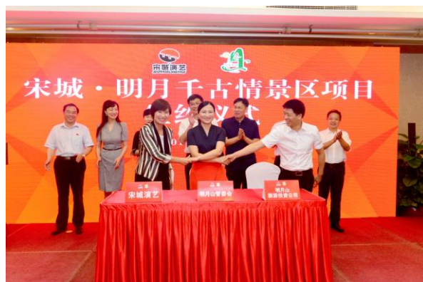
宋城·明月千古情景区项目签约仪式