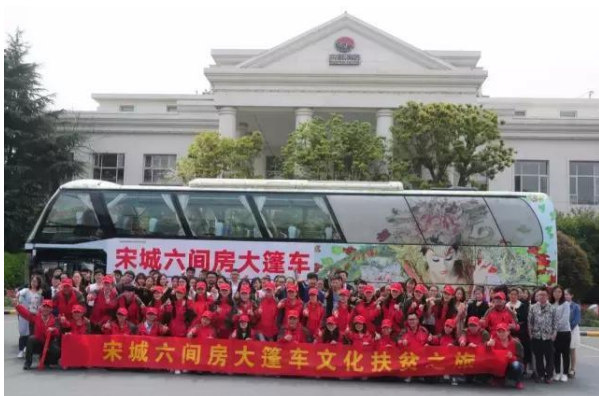
六间房大篷车，开启中国“网络直播+公益”新时代

报告期内，六间房在娱乐直播业务板块上进行了大规模的升级和创新。在应用层面，六间房持续提升移动、桌面等界面的用户体验，并加大了渠道推广力度；在核心技术层面，六间房尝试采用大数据手段高效匹配用户与内容；在运营层面，六间房配合并协助政府监管部门制定和执行系列监管规范，并开展了长达一个月、行程上万公里的宋城六间房大篷车文化扶贫之旅，直播扶贫、文化扶贫、艺术扶贫，为数万名山区群众送去了美轮美奂的艺术盛宴，开启了中国“网络直播+公益”新时代，得到监管部门的高度评价。灵动时空于 4 月份推出新产品《连斩无双》，数周位于 iOS 付费榜前 20 名，至今总流水表现超出预期；欢朋游戏直播在有限的运营和推广资源下，已经积累了一定数量的游戏主播与基础用户群。2017 年 7 月，由六间房开发和运营的全球首个 AR 女子演艺团体“ And.II ”发布。公司管理层认为，全球娱乐产业经过大众媒体偶像、分众个性化偶像的阶段后，必定随年轻一代消费者群体的需求进入“定制偶像”阶段。增强现实（Augmented Reality）、虚拟现实（Virtual Reality）技术是定制偶像的基础，代表了科技娱乐的未来。