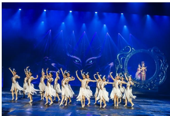
宁乡项目顺利试营业、《炭河千古情》隆重试演

报告期内，宋城西樵山岭南千古情景区项目以及宋城明月千古情景区项目相继签约，标志着轻资产运营模式的持续性发