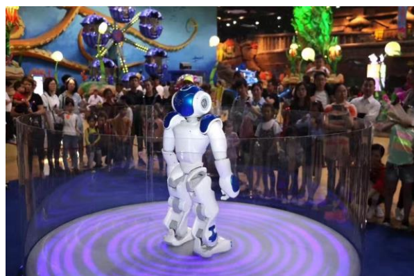
烂苹果乐园推出互动节目《卡通机器人见面会》