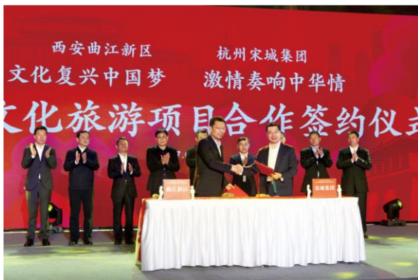
“西安千古情景区”项目合作签约仪式

报告期内，公司上海、西安、桂林、张家界等自主投资项目用地、立项、报建、建设均有序推进，各大项目的景区规划和设计以及演出的策划和编创工作已基本完成。其中，桂林项目于 6 月 23 日正式开工奠基，四大项目为“演艺宋城”在全国继续开疆辟土打下坚实基础。