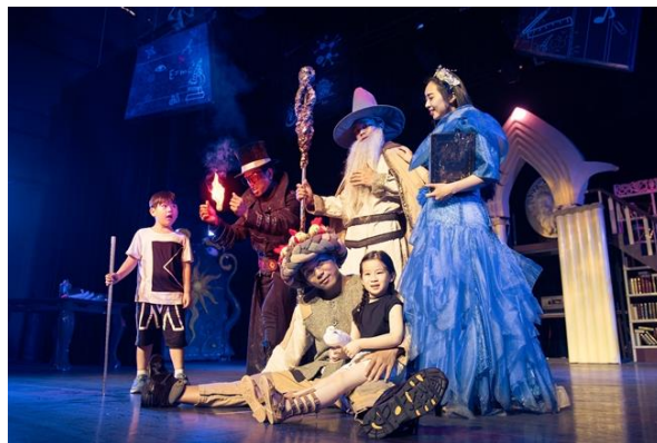
烂苹果乐园大型沉浸式演出《魔法奇遇记》

立足于中国传统文化的深厚土壤，秉承“建筑为形，文化为魂”的经营理念，公司打造的“宋城”、“千古情”两大品牌