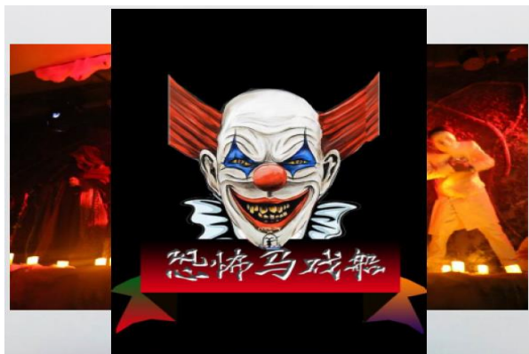
杭州乐园打造沉浸式演出《恐怖马戏船》

报告期内，公司以提升品质为导向，继续完善原有的项目及品牌建设，实现各大景区整改与创新并存，提升整体竞争实力。6 月 17 日， 杭州宋城景区 与加拿大时光工厂合作大型高科技时空秀《古树魅影》惊艳亮相，用先进的声、光、电等科技手段营造出 360 度全景剧幕，丰富了游客的夜间游玩体验。宋城景区宋河西街、宋河花街整改完成并正式开放，通过氛围营造及品牌店铺的引入，延长了游客停留时间，扩大了景区游览面积。 杭州宋城旅游区湘湖片区 紧密结合市场需求，推出创新剧目。其中， 杭州乐园 打造沉浸式演出《恐怖马戏船》， 烂苹果乐园 推出寓教于乐类儿童剧《数码奇遇》及沉浸式演出《魔法奇遇记》，并将机器人与表演互动相结合，推出了互动节目《卡通机器人见面会》，增加了游客的体验度和观赏度。 丽江千古情景区 对茶马古街的商铺进行完善整改，增强古街氛围；在文化广场新建爬花楼，搭建阳光大棚，加强景区的绿化管护和提升工作。 九寨千古情景区 对景区图腾柱、色嫫女神等重要建筑进行完善，丰富景区氛围，并在风情街出口处新建“时光隧道”项目，丰富游客体验度。