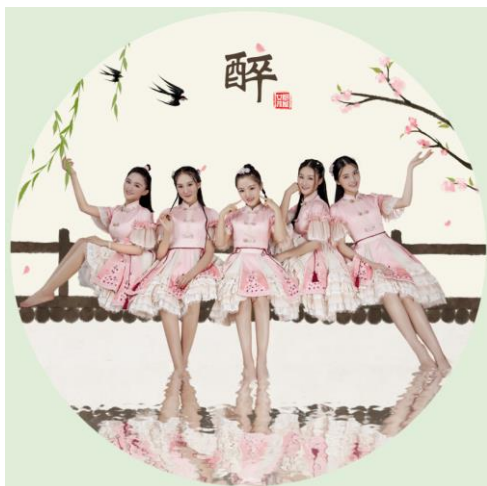
跨次元壁演绎虚拟歌姬汐单曲《醉》