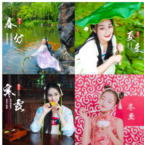
真人版二十四节气图发布

公司与浙江传媒学院继续教育学院联合创办的全国首个“主持与播音（新媒体主播方向）专业”学生已经完成了第一学年的课程，总体情况良好，同时第二届的招生工作目前正有序进行中，未来将会有更多高素质的主播人才服务于宋城演艺旗下现场娱乐、互联网娱乐等板块。