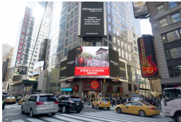
杭州宋城“我回大宋”全民穿越主题活动，创世界纪录

报告期内，公司强化整合推广优势，媒体投放渠道进一步优选，升级新媒体内容宣发模式，充分利用微博、微信、第三方平台 APP 等新渠道进行宣传推广，做大公司品牌影响力。 三亚宋城旅游区 充分利用影视、现场娱乐以及新媒体渠道，以线下配合线上模式，进行景区的宣传推广。海南旅游卫视节目《女神的假期》、三亚广播电视台天涯之声广播《行走的直播间》、中央电视台 5 套拍摄《三亚市旅游宣传片》、CCTV 发现之旅《美丽中华行》、宣传委《三亚市宣传片》、《带你游天涯》等综艺节目剧组的拍摄及网络旅游宣传视频对活动进行了轮番报道，在明星效应、粉丝经济的带动下，旅游区在媒体上收获了极大的关注。 杭州宋城旅游区湘湖片区 积极拓展线上线外异业合作项目，通过跨界营销、资源共享，实现新的增长点。从实物赞助到景娱联动，从活动合作到借势推广，湘湖片区在合作领域逐渐形成独有模式。