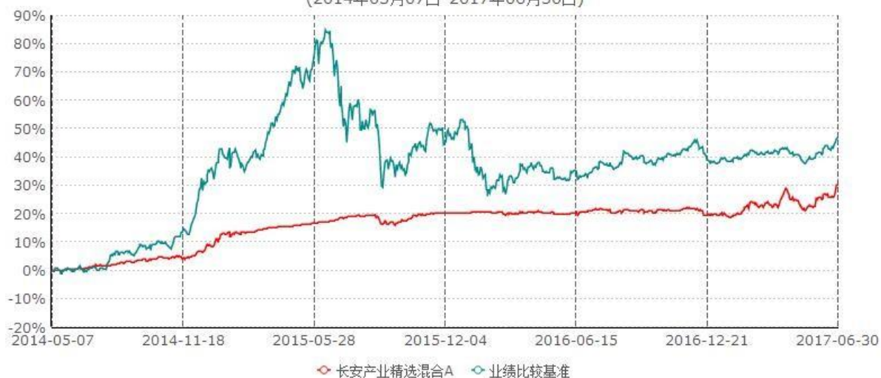
长安产业精选混合A累计净值增长率与业绩比较基准收益率历史走势对比图 (2014年05月07日-2017年06月30日)