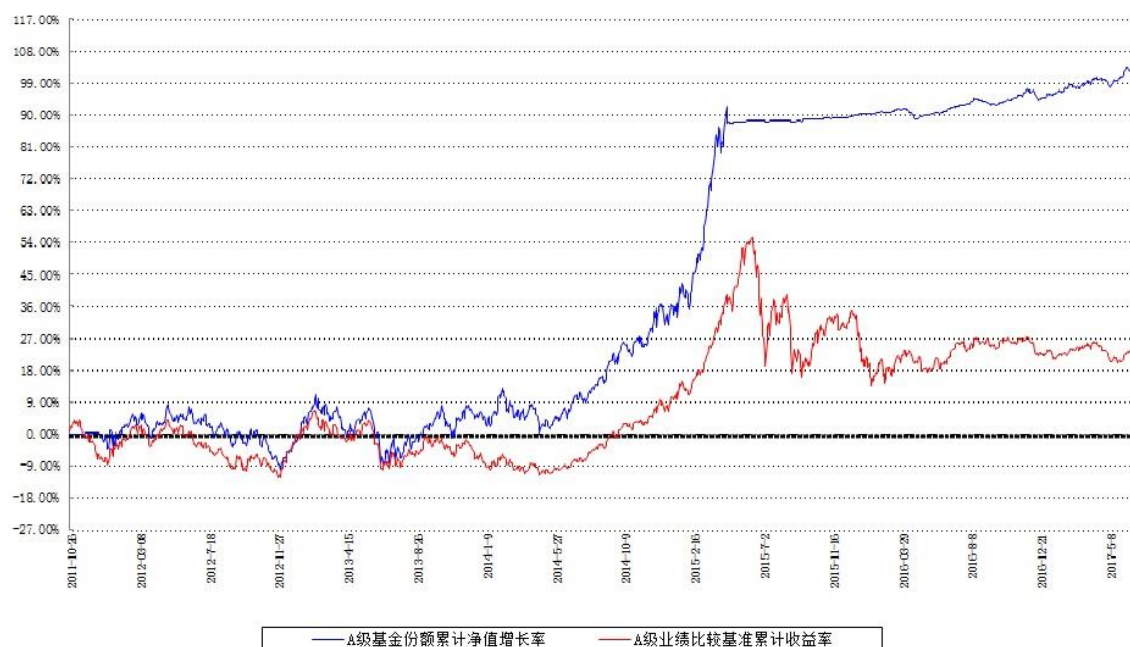
A级基金份额累计净值增长率与同期业绩比较基准收益率的历史走势对比图