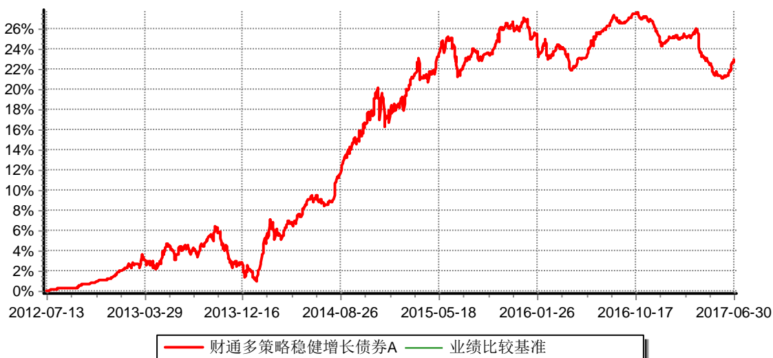
财通多策略稳健增长债券型证券投资基金A 累计净值增长率与业绩比较基准收益率历史走势对比图 (2012年7月13日-2017年6月30日)