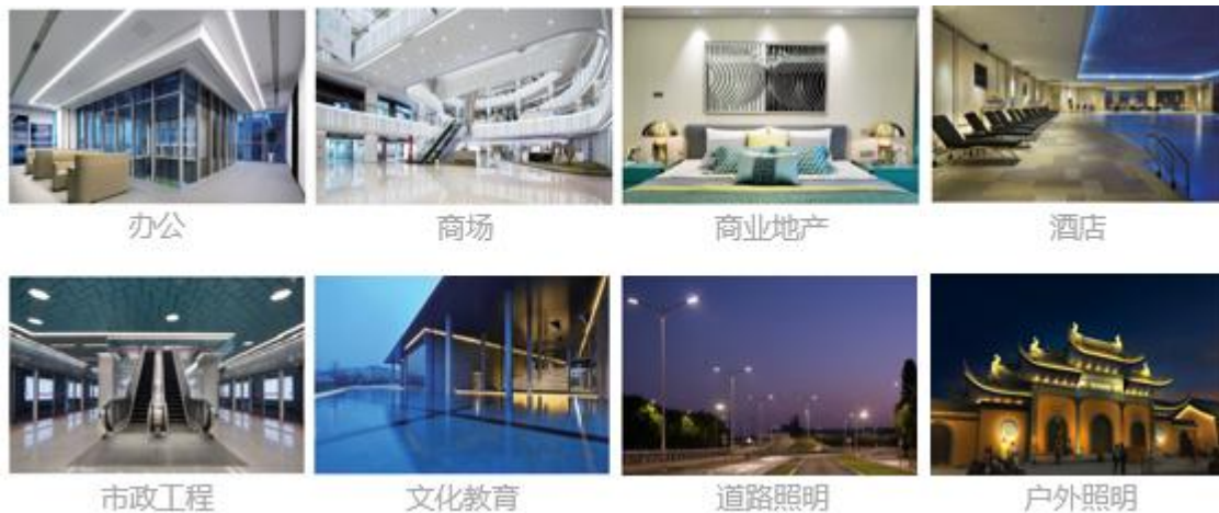
图表 2 商业照明主要领域及产品示例

商业照明产品主要包括筒灯/射灯类产品、灯盘、泛光灯、路灯、天棚灯等系列，涉及的细分市场涵盖商业连锁、酒店、超市、百货、工业、办公、学校、医院、地铁等领域。