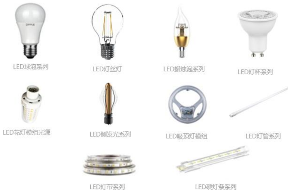
图表 3 光源主要产品示例

公司的光源产品主要包括 LED 节能电光源（球泡、灯杯、蜡烛泡灯）、灯管和支架等。