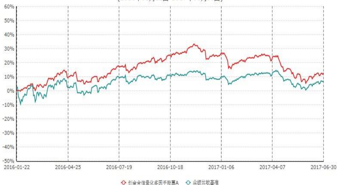
创金合信量化多因子股票A累计净值增长率与业绩比较基准收益率历史走势对比图 (2016年01月22日-2017年06月30日)