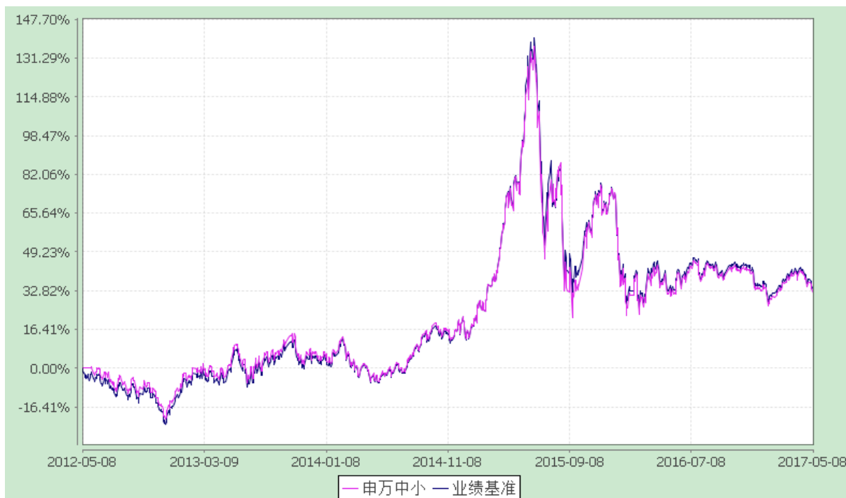
申万菱信中小板指数分级证券投资基金 份额累计净值增长率与业绩比较基准收益率历史走势对比图 (2017年1月1日至2017年5月8日)

注：1.根据《基金合同》的相关规定，原申万菱信中小板指数分级证券投资基金分级运作期共包含五个运作周年。分级运作期结束，无需召开基金份额持有人大会，自动转换为上市开放式基金（LOF）。2017年5月8日，申万菱信中小板指数分级证券投资基金分级运作期结束，申万菱信中小板指数分级证券投资基金之稳健收益类份额、申万菱信中小板指数分级证券投资基金之积极进取类份额按照《基金合同》约定折算成场内申万菱信中小板指数分级证券投资基金之申万中小板份额，基金名称变更为“申万菱信中小板指数证券投资基金（LOF）”；