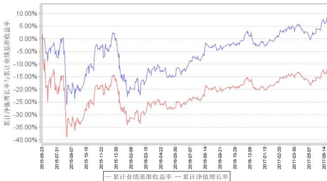
大数据300A级累计净值增长率与同期业绩比较基准收益率的历史走势对比图