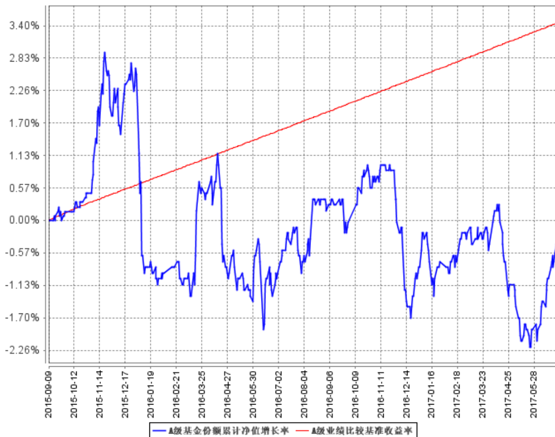
A级基金份额累计净值增长率与同期业绩比较基准收益率的历史走势对比图