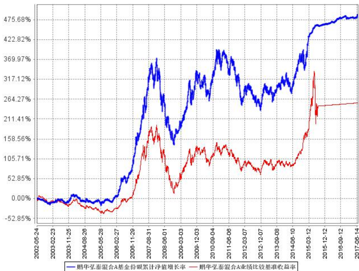
鹏华弘泰混合A基金份额累计净值增长率与同期业绩比较基准收益率的历史走势对比图