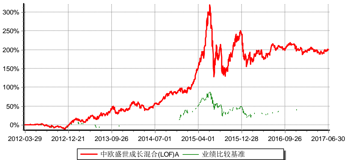
累计净值增长率与业绩比较基准收益率历史走势对比图 (2012年03月29日-2017年06月30日)