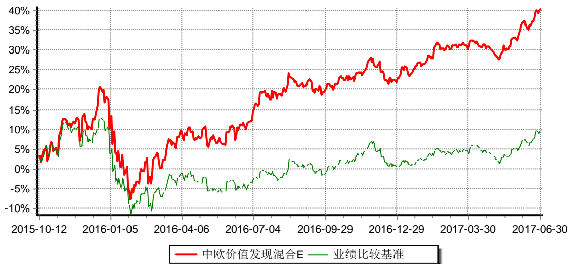
累计净值增长率与业绩比较基准收益率历史走势对比图 (2015年10月12日-2017年06月30日)

注：本基金自2015年10月8日起新增E类份额，图示日期为2015年10月12日至2017年6月30日。