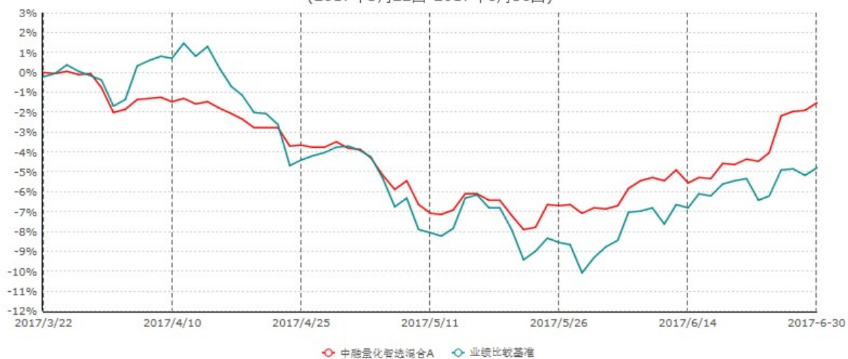
中融量化智选混合A份额累计净值增长率与业绩比较基准收益率历史走势对比图 (2017年3月22日-2017年6月30日)