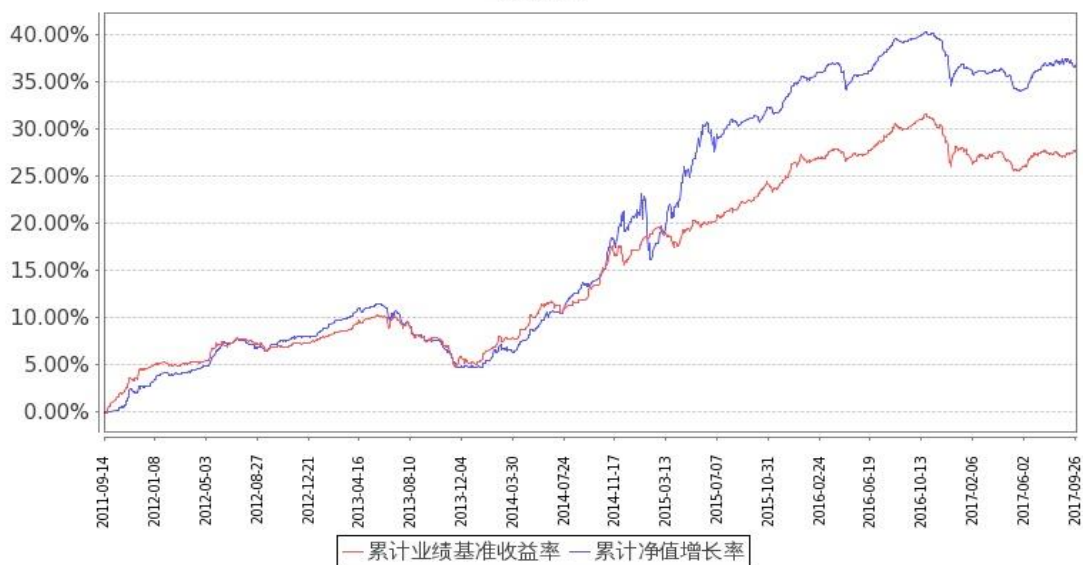
图 2: 嘉实信用债券 C 基金份额累计净值增长率与同期业绩比较基准收益率的历史走势对比图