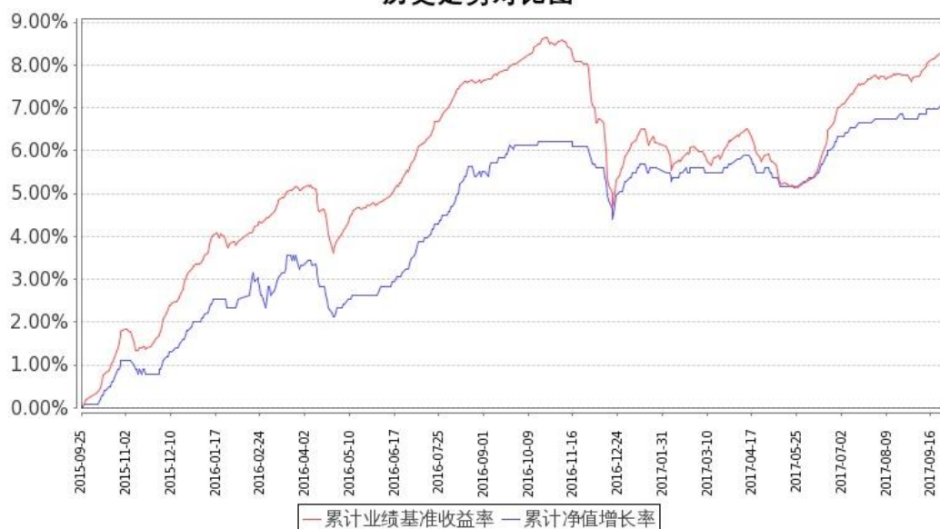
图 2：嘉实增强收益定期债券 C 基金份额累计净值增长率与同期业绩比较基准收益率的历史走势对比图