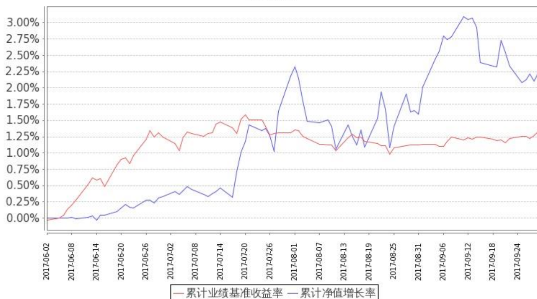
图 2：嘉实稳宏债券 C 基金份额累计净值增长率与同期业绩比较基准收益率的历史走势对比图