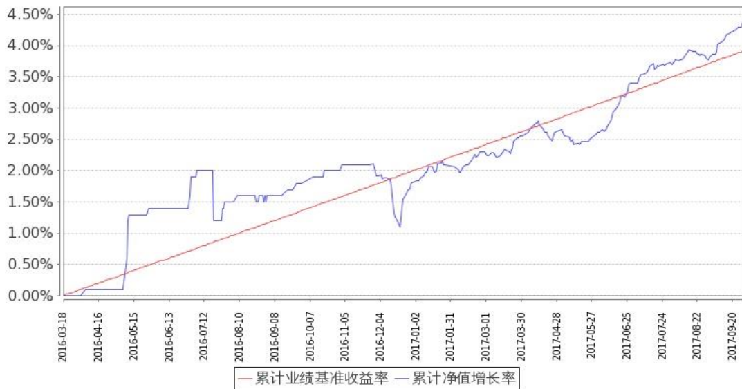
图 1：嘉实稳祥纯债债券 A 基金份额累计净值增长率与同期业绩比较基准收益率的历史走势对比图