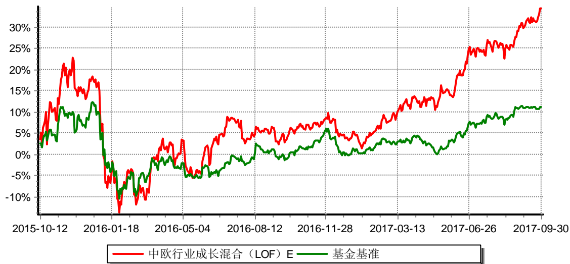
累计净值增长率与业绩比较基准收益率历史走势对比图 (2015年10月12日-2017年09月30日)

注：本基金于2015年10月8日新增E份额，图示日期为2015年10月12日至2017年9月30日。