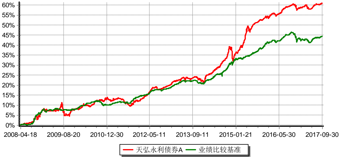
本基金B类累计净值增长率与业绩比较基准收益率的历史走势对比图