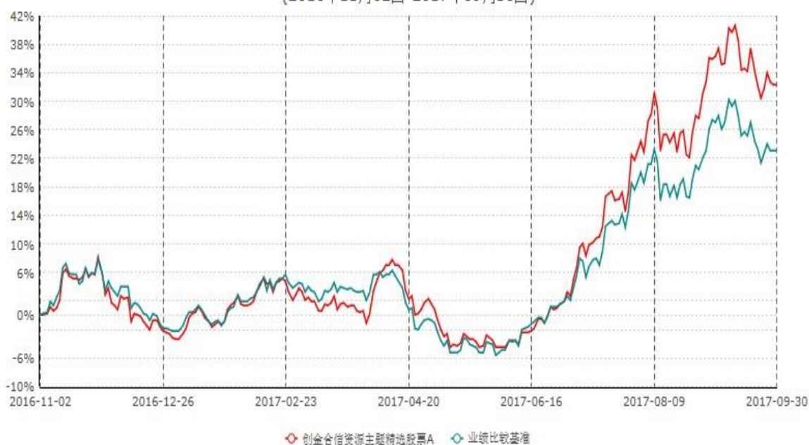
创金合信资源主题精选股票A累计净值增长率与业绩比较基准收益率历史走势对比图 (2016年11月02日-2017年09月30日)