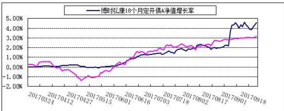
2. 博时弘康18个月定开债C: