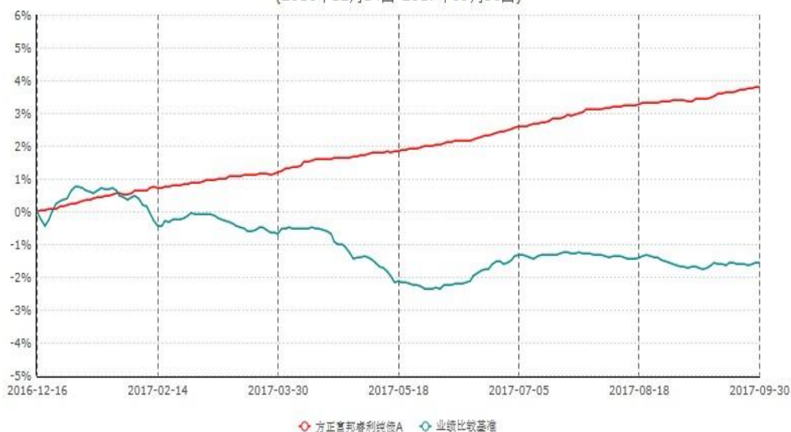
方正富邦睿利纯债A份额累计净值增长率与业绩比较基准收益率历史走势对比图 (2016年12月14日-2017年09月30日)