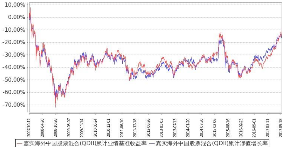
图：嘉实海外中国股票混合(QDII)基金份额累计净值增长率与同期业绩比较基准收益率的历史走势对比图(2007年10月12日至2017年9月30日)

注：按基金合同约定，本基金自基金合同生效日起6个月内为建仓期。建仓期结束时本基金各项资产配置比例符合基金合同第十四条（（九）投资限制）的规定：（1）持有同一家银行的存款不得超过本基金净值的20%，在托管账户的存款可以不受上述限制；（2）持有同一机构（政府、国际金融组织除外）发行的证券市值不得超过基金净值的10%；（3）本公司管理的全部基金不得持有同一机构10%以上具有投票权的证券发行总量，指数基金可以不受上述限制；（4）持有非流动性资产市值不得超过基金净值的10%；（5）相对于基金资产净值，股票投资比例为60—100%。