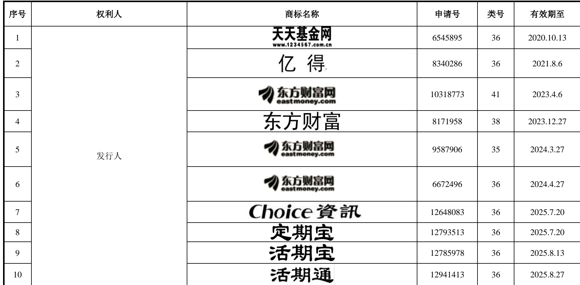
附表七：发行人及其子公司的商标