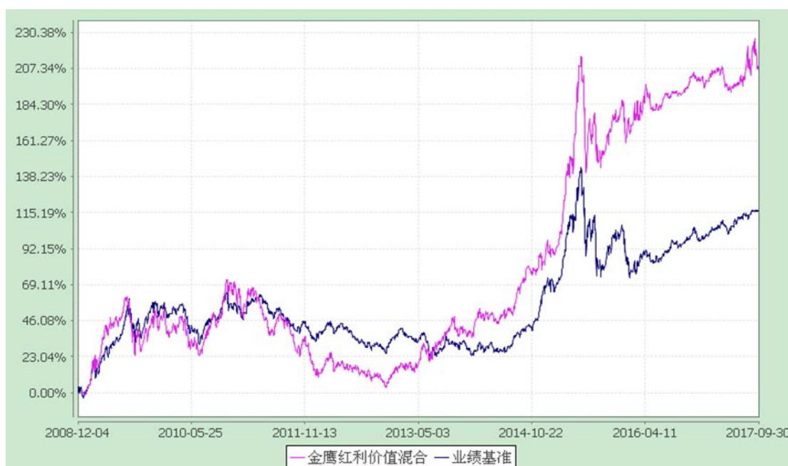
金鹰红利价值灵活配置混合型证券投资基金 累计净值增长率与业绩比较基准收益率历史走势对比图 (2008 年 12 月 4 日至 2017 年 9 月 30 日)