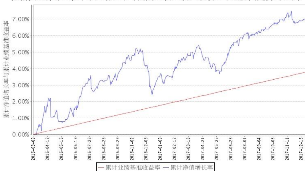
安信安盈保本A累计净值增长率与同期业绩比较基准收益率的历史走势对比图