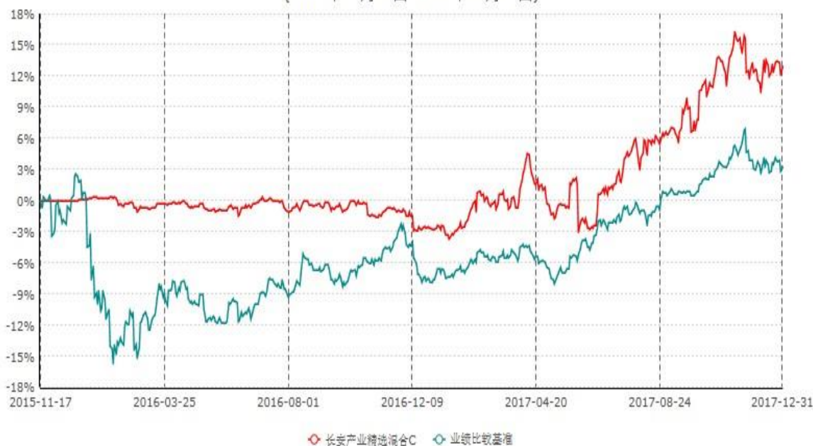
长安产业精选混合C累计净值增长率与业绩比较基准收益率历史走势对比图 (2015年11月16日-2017年12月31日)

2015 年 11 月 16 日新增长安产业精选混合 C，实际首笔 C 类份额申购申请于 2015 年 11 月 17 日确认，图示日期为 2015 年 11 月 16 日至 2017 年 12 月 31 日。