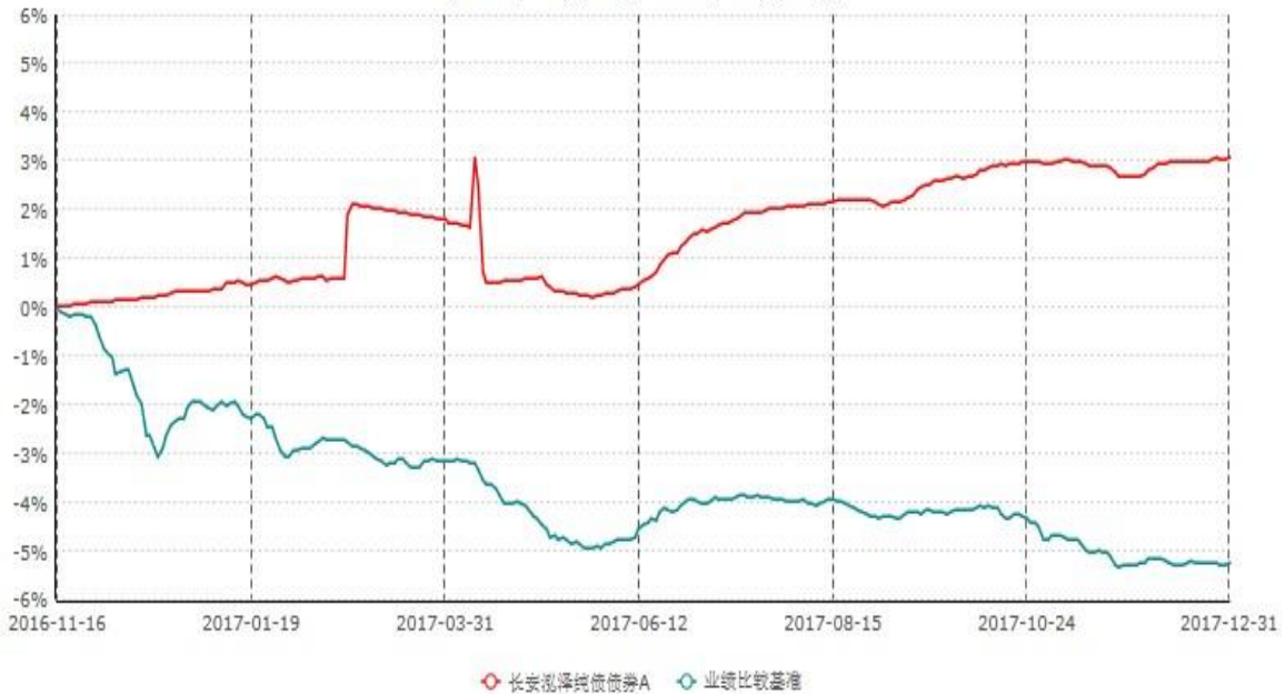
长安泓泽纯债债券A累计净值增长率与业绩比较基准收益率历史走势对比图 (2016年11月16日-2017年12月31日)

本基金基金合同生效日为 2016 年 11 月 16 日，按基金合同规定，本基金自基金合同生效起 6 个月为建仓期，截止到建仓期结束时，本基金的各项投资组合比例已符合基金合同的相关规定。基金合同生效日至报告期期末，本基金运作时间已满一年，图示日期为 2016 年 11 月 16 日至 2017 年 12 月 31 日。