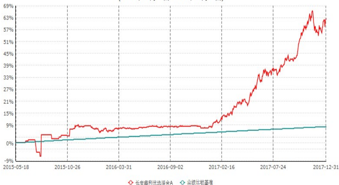
长安鑫利优选混合A累计净值增长率与业绩比较基准收益率历史走势对比图 (2015年05月18日-2017年12月31日)

长安鑫利优选混合 A 生效日为 2015 年 5 月 18 日，按基金合同规定，本基金自基金合同生效起 6 个月为建仓期，截止到建仓期结束时，本基金的各项投资组合比例已符合基金合同的相关规定。图示日期为 2015 年 5 月 18 日至 2017 年 12 月 31 日。