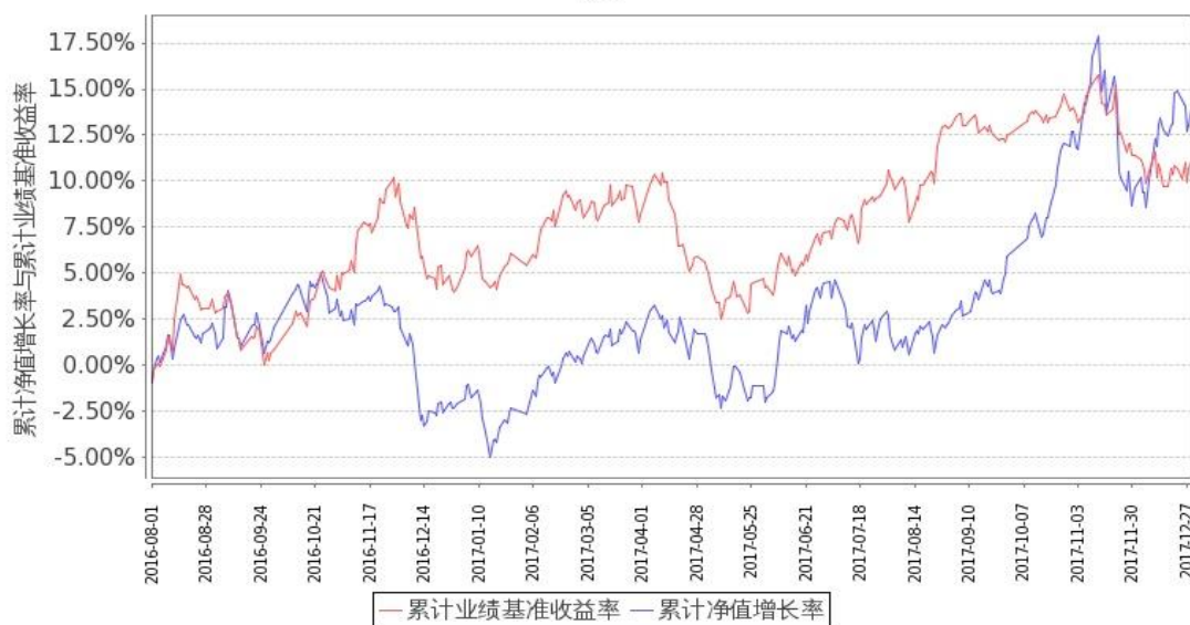
图 2：嘉实成长收益混合 H 基金份额累计净值增长率与同期业绩比较基准收益率的历史走势对比图（2016 年 8 月 1 日至 2017 年 12 月 31 日）

注：按基金合同规定，本基金自基金合同生效日起 6 个月内为建仓期。建仓期结束时本基金的各项投资比例符合基金合同第十八条（二）投资范围和（六）投资组合比例限制的约定：（1）投资于股票、债券的比例不低于基金资产总值的 80%；（2）持有一家公司的股票，不得超过基金资产净值的 10%；（3）本基金与由本基金管理人管理的其他基金持有一家公司的发行的证券，不得超过该证券的 10%；（4）投资于国债的比例不低于基金资产净值的 20%；（5）本基金的股票资产中至少有 80%属于本基金名称所显示的投资内容；（6）法律法规或监管部门对上述比例限制另有规定的，从其规定。