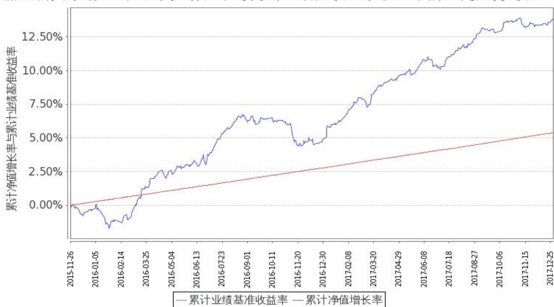
图 2: 嘉实新兴市场 C2 份额累计净值增长率与同期业绩比较基准收益率的历史走势对比图 (2015 年 11 月 26 日至 2017 年 12 月 31 日)

注: 按基金合同和招募说明书的约定, 本基金自基金合同生效日起 6 个月内为建仓期, 建仓期结束时本基金的各项投资比例符合基金合同“第十五部分(二)投资范围和(四)投资限制”的有关约定。