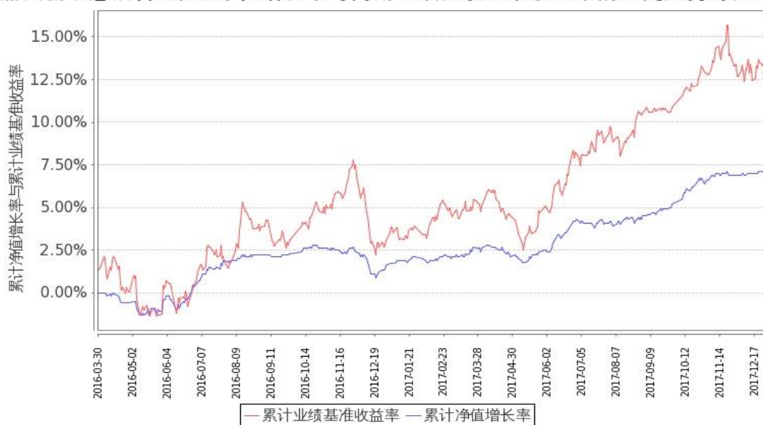
图 2：嘉实新常态混合 C 基金份额累计净值增长率与同期业绩比较基准收益率的历史走势对比图