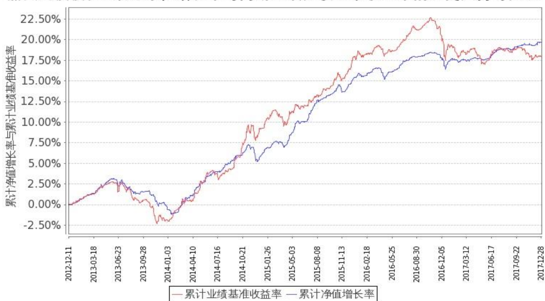
图 2: 嘉实纯债债券 C 基金份额累计净值增长率与同期业绩比较基准收益率的历史走势对比图 (2012 年 12 月 11 日至 2017 年 12 月 31 日)

注: 按基金合同和招募说明书的约定, 本基金自基金合同生效日起 6 个月内为建仓期, 建仓期结束时本基金的各项投资比例符合基金合同“第十二部分(二)投资范围和(六)投资限制”的有关约定。