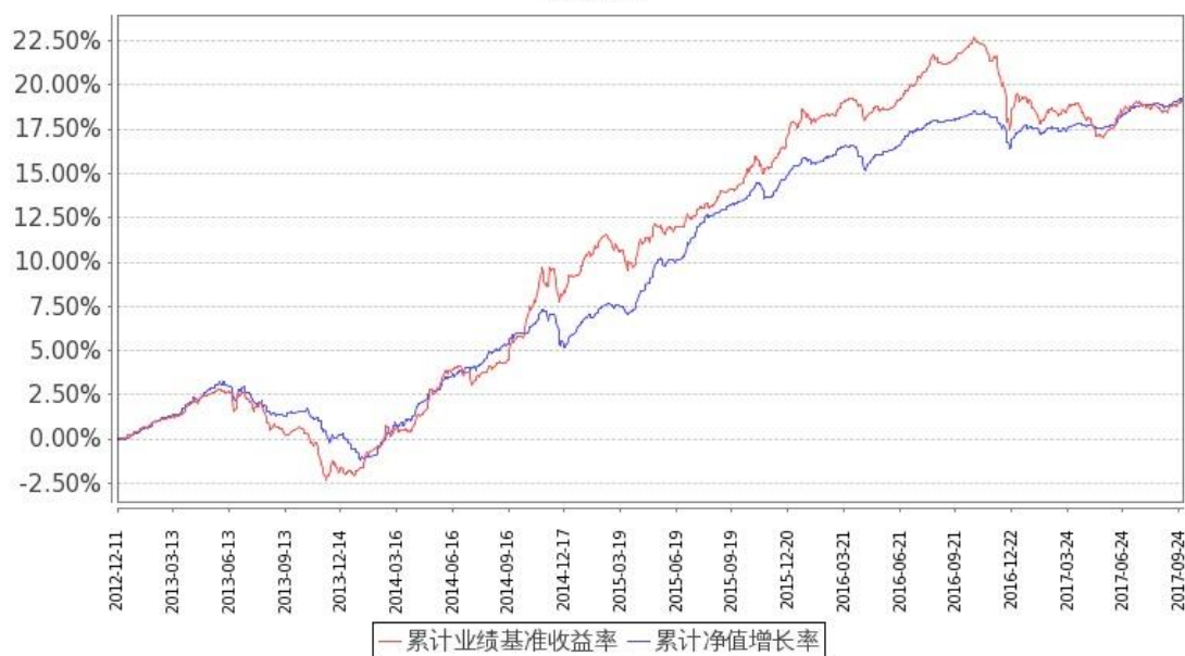
图2：嘉实纯债债券C基金份额累计净值增长率与同期业绩比较基准收益率的历史走势对比图