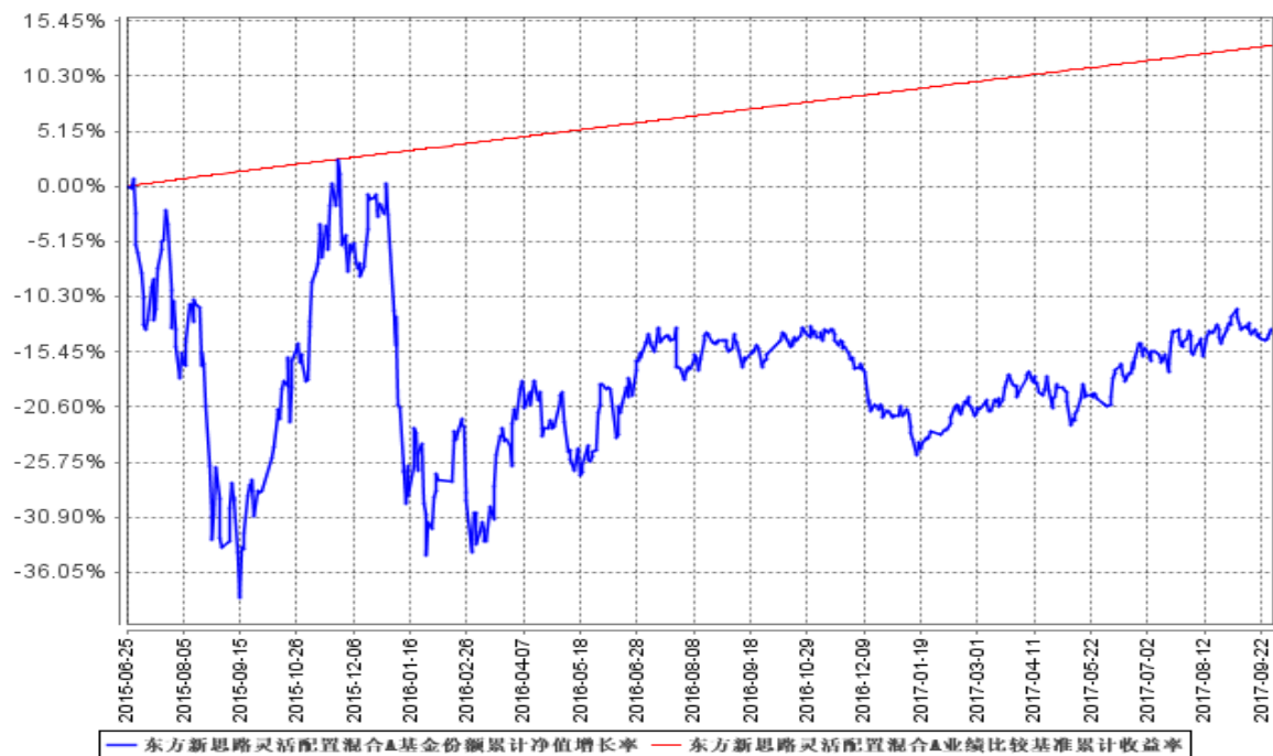
东方新思路灵活配置混合A基金份额累计净值增长率与同期业绩比较基准收益率的历史走势对比图

(二) 自基金合同生效以来基金累计净值增长率变动及其与同期业绩比较基准收益率变动的比较