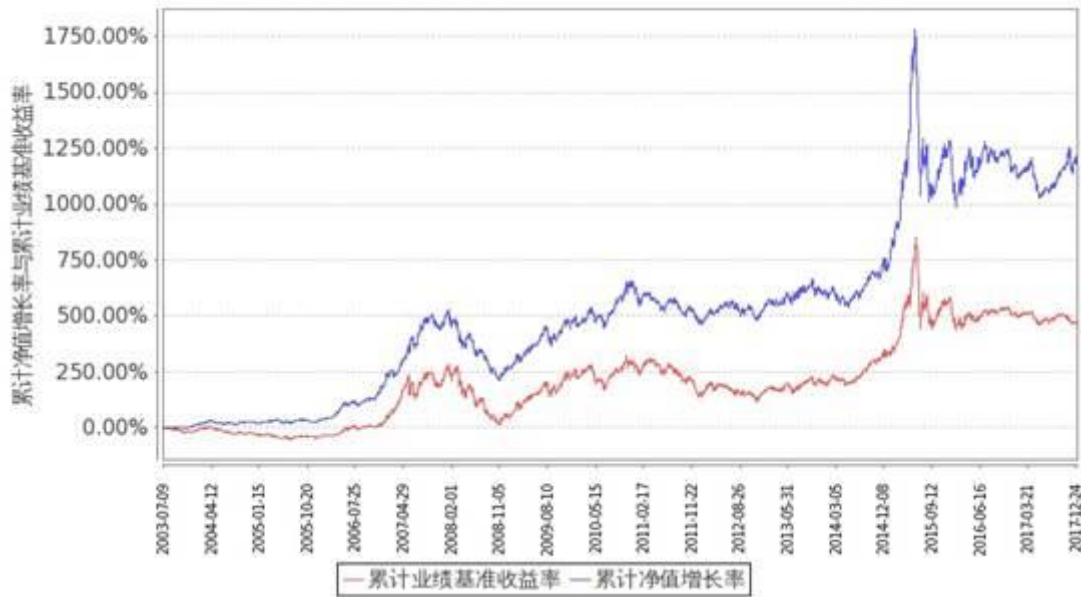
图：嘉实增长混合份额累计净值增长率与同期业绩比较基准收益率的历史走势对比图 (2003年7月9日至2017年12月31日)

注1：按基金合同规定，本基金自基金合同生效日起6个月内为建仓期。建仓期结束时本基金各项资产配置比例符合基金合同第三部分（四（一）投资范围和（四）各基金投资组合比例限制）的规定：（1）投资于股票、债券的比例不低于基金资产总值的80%；（2）持有一家公司的股票，不得超过基金资产净值的10%；（3）本基金与由基金管理人管理的其他基金持有一家发行的证券，不得超过该证券的10%；（4）投资于国债的比例不低于基金资产净值的20%；（5）本基金的股票资产中至少有80%属于本基金名称所显示的投资内容；（6）法律法规或监管部门对上述比例限制另有规定的，从其规定。