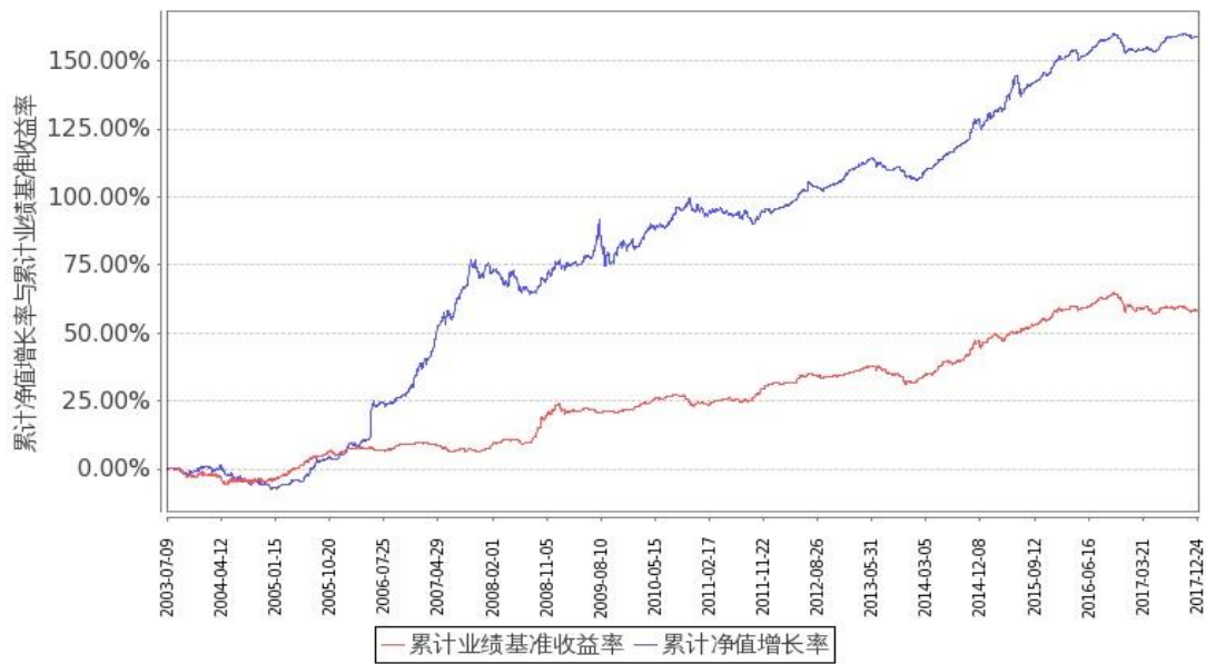
图：嘉实债券份额累计净值增长率与同期业绩比较基准收益率的历史走势对比图