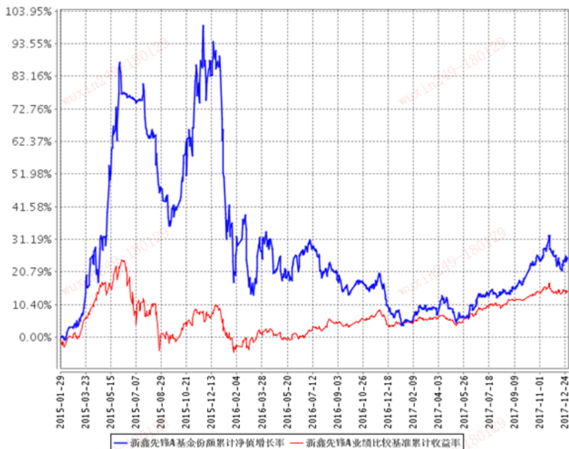
新鑫先锋A基金份额累计净值增长率与同期业绩比较基准收益率的历史走势对比图