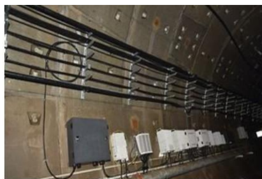
通信系统 (含CCTV子系统)

经营模式: 公司参与项目招投标获取智能轨道交通项目, 依据需求为客户提供融合自主研发的核心软硬件产品的智能化系统解决方案, 通过整合上下游零部件、机械加工、工程施工等供应链资源, 实现项目系统整体交付并提供维保服务。