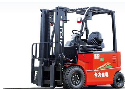
G 系列锂电池叉车获安徽省机械工业科技进步一等奖