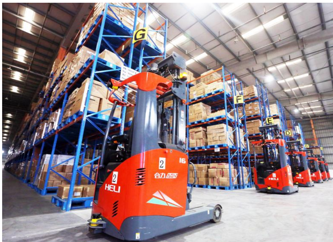
公司承建的智能仓储系统项目