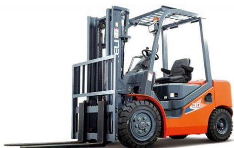
H3 系列内燃叉车荣获国家机械工业科技进步三等奖