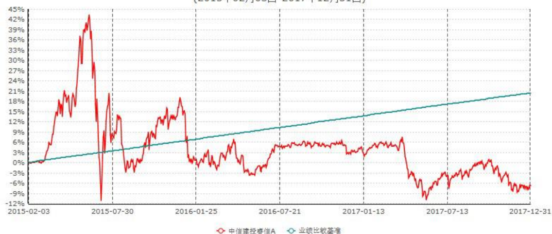
中信建投睿信A累计净值增长率与业绩比较基准收益率历史走势对比图 (2015年02月03日-2017年12月31日)