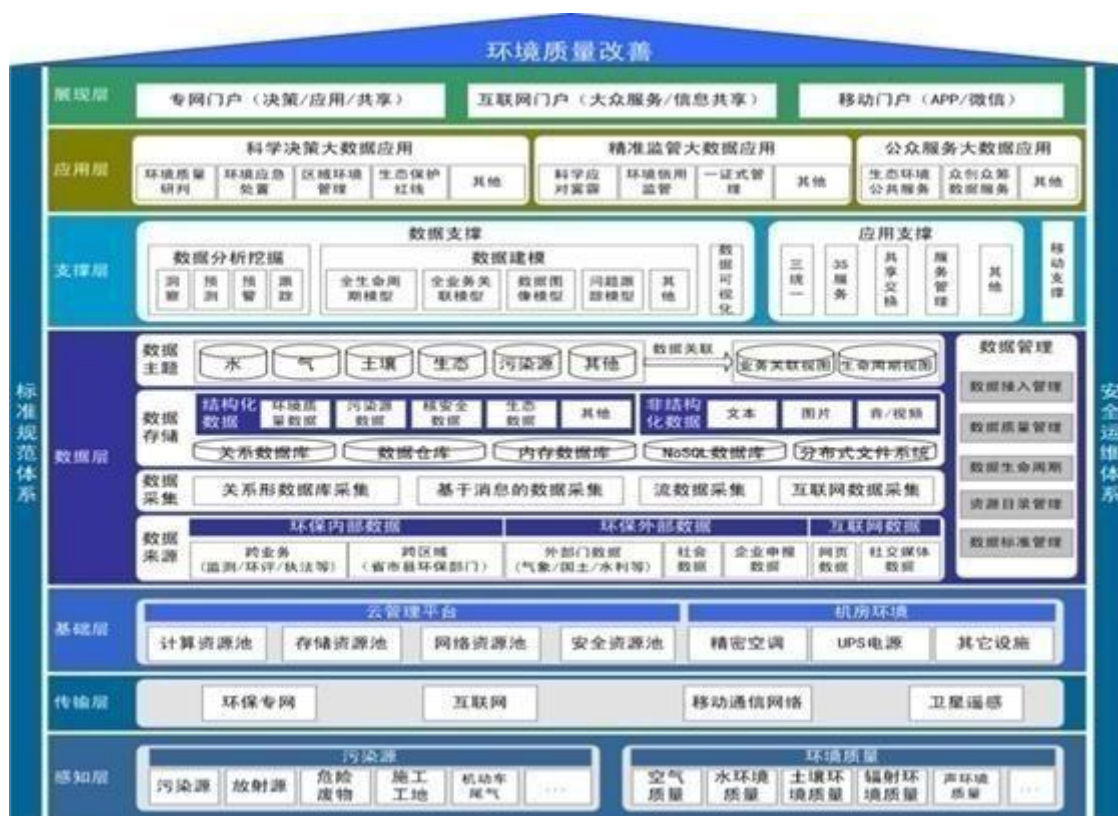
图 2 智慧环保安全运维平台构架图

环境治理方面，报告期内在市场政策的有利推动下，嘉园环保气务治理业绩大幅增涨，其中大风量 RTO 项目及旋转 RTO 项目实现落地，为后续同类业务的开拓奠定了基础。另一方面，承接上海老港垃圾渗滤液项目，增强了嘉园环保在渗滤液处理行业的知名度和影响力，标志着嘉园环保在水务治理领域的竞争力进一步提升。智慧环保平台（图 2）完成建设及软件测试调整，目前已接入多个站点数据，可实时监控站点每日产水情况、实时水质、药剂耗量等数据，并及时进行故障报警及养护维修等处理，该平台即将投入试运行。