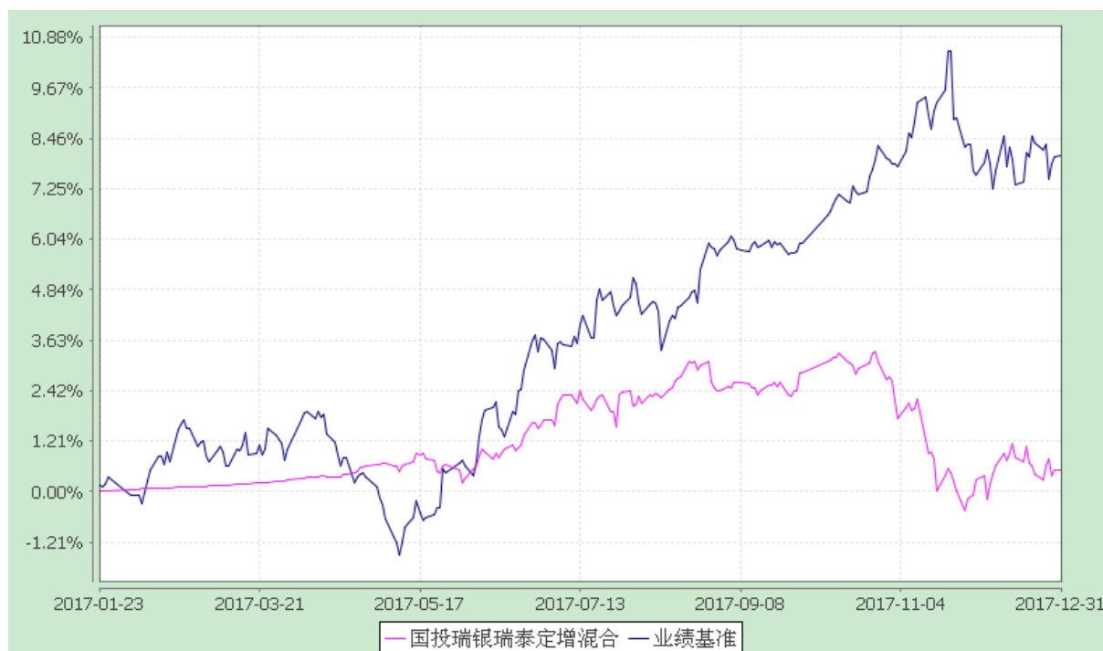
国投瑞银瑞泰定增灵活配置混合型证券投资基金 份额累计净值增长率与业绩比较基准收益率的历史走势对比图 (2017 年 1 月 23 日至 2017 年 12 月 31 日)

注：1、本基金建仓期为自基金合同生效日起的六个月。截至建仓期结束，本基金各项资产配置比例符合基金合同及招募说明书有关投资比例的约定。